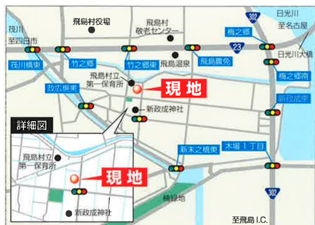
村立第一保育所400m、飛島村役場1200m、 飛島敬老センター1400m

80坪以上のゆとりのある敷地。子育て・教育・福祉に充実した住環境で ご家族のライフスタイルに合わせた個性あふれるオーダーメイドのマイホームを。