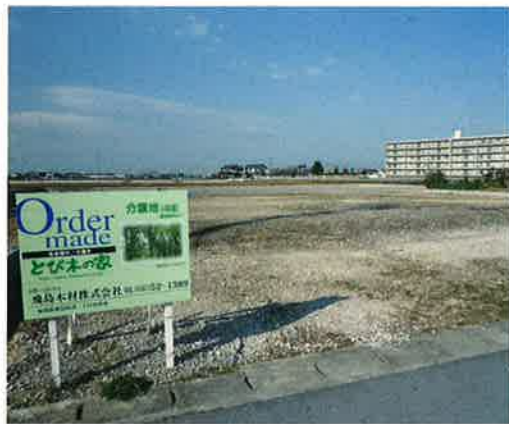
太陽光ソーラーパネル設置の場合、行政(村)からの補助金あり。現地(2010年11月)撮影